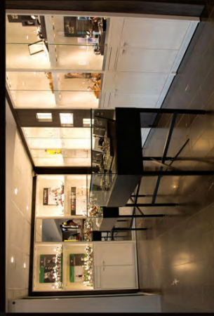
Fra Uhrmageriet i Århus. MJ2 har også løst en række shop-in-shop opgaver for Tissot og Certina, hvoraf to kan ses i baggrunden her.

– Vi kombinerer deres input med vores egen viden og erfaring om branchen og om hvilke inventarløsninger, der fungerer. Dermed sikrer vi, at vores kunder får den optimale løsning på sin butik eller shop in shop, både hvad angår funktionalitet, udtryk og pris. ■ www.mj2.dk